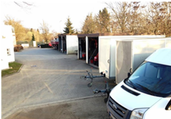
Bauhof und Maschinenstandort

Im Arbeitsfeld Landschaftspflege und Naturschutz können auch Menschen mit körperlichen Einschränkungen eingesetzt werden und neben einem strukturierten Tagesablauf den Umgang mit Werkzeug und Maschinen erlernen.